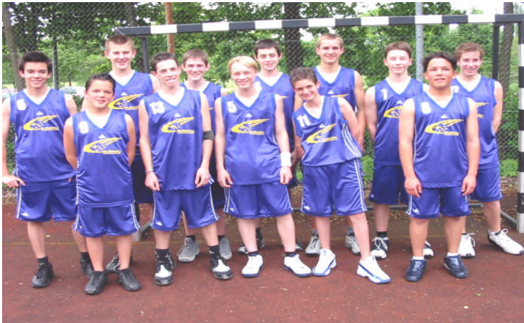
U 16 bei der Oberliga-Qualifikation