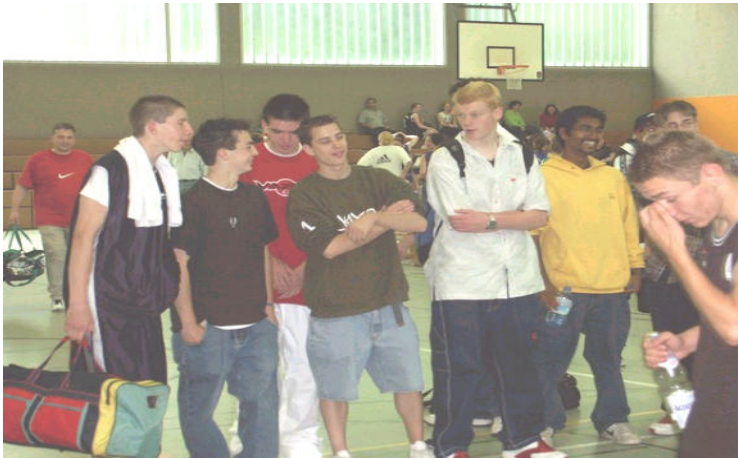
U 18 bei dem Turnier in Voerde